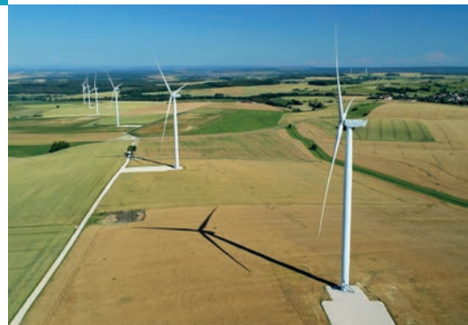
Parc éolien Les Hauts Chemins, commune de Esley (88).

Les autorisations obtenues en 2014 et 2016 par Neoen ont été validées définitivement courant 2020 pour les 18 éoliennes de 2.2 MW situées sur les communes de Gelvécourt-et-Adompt, Les Ableuvenettes, Dompaire, Madonne-et-Lamerey, Damas-et-Bettegney, Ville-sur-Illon et Harol, sur la Communauté de communes Mirecourt-Dompaire. Les travaux ont démarré en février 2021, pour une mise en service programmée début 2022. Le parc produira l'équivalent de la consommation électrique (hors chauffage) de 56 600 foyers.