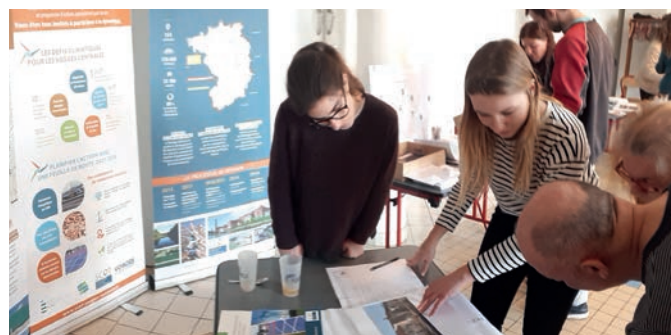
Permanence réalisée par H2air & Terr'EnR le 7 mars 2020 à Gruey-lès-Surance

Quant à l'impact sur la biodiversité, l'implantation du parc (loin des forêts et lisières forestières) a été minutieusement étudiée pour minimiser son effet sur les chauves-souris et les oiseaux. Un système de détection et d'effarouchement sera installé. H2air s'est aussi engagé à réaliser une étude acoustique et un suivi ornithologique pendant 3 ans en phase d'exploitation ; de quoi garantir le plus faible impact du parc sur son environnement.